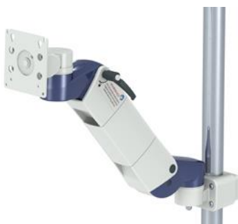
Rundrohrhalterung horizontal und vertikal schwenkbarer