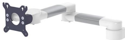
Horizontal schwenkbarer Tragarm zweifach