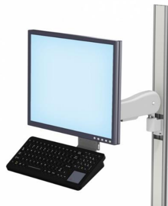
Halterung Profilschiene horizontal schwenkbar, Neigefunktion des Med-PCs und der Tastatur