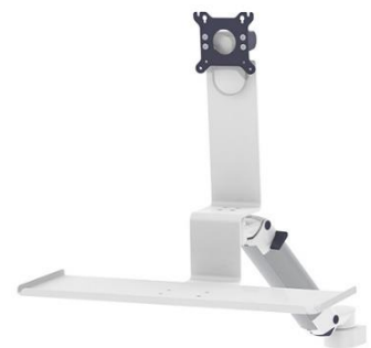
Halterung zweifach schwenkbar für PC und Tastatur, Tastatur aufklappbar